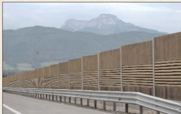
Forschungsversuch: Thermohölzer sollen anstatt imprägnierter Hölzer bei Lärmschutzwänden in den Einsatz kommen.

Holz. Dieses zeichnet sich - insbesondere wenn Laubholz als Rohmaterial verwendet wird - durch ein deutlich reduziertes Quell-Schwindverhalten und eine dadurch höhere Dimensionsstabilität aus. Ein weiterer wesentlicher Vorteil ist die deutlich gesteigerte Dauerhaftigkeit von Holz, die sonst nur durch Imprägnierung erzielt werden kann.