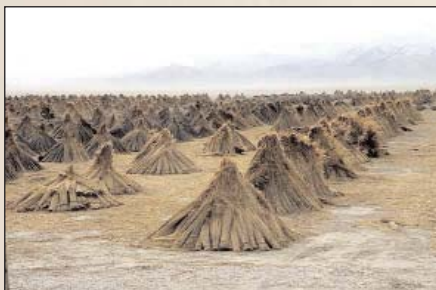
Schilf wird eines der Hauptbestandteile der nachhaltigen Lärmschutzwände sein. An den Außenseiten wird Thermoholz verwendet, innen dient das Schilf als Absorptionsmaterial. Schilfplantage in Ungarn.

Thermisch behandeltes Holz („thermally modified timber“ - TMT) ist ein durch hohe Temperaturen modifiziertes